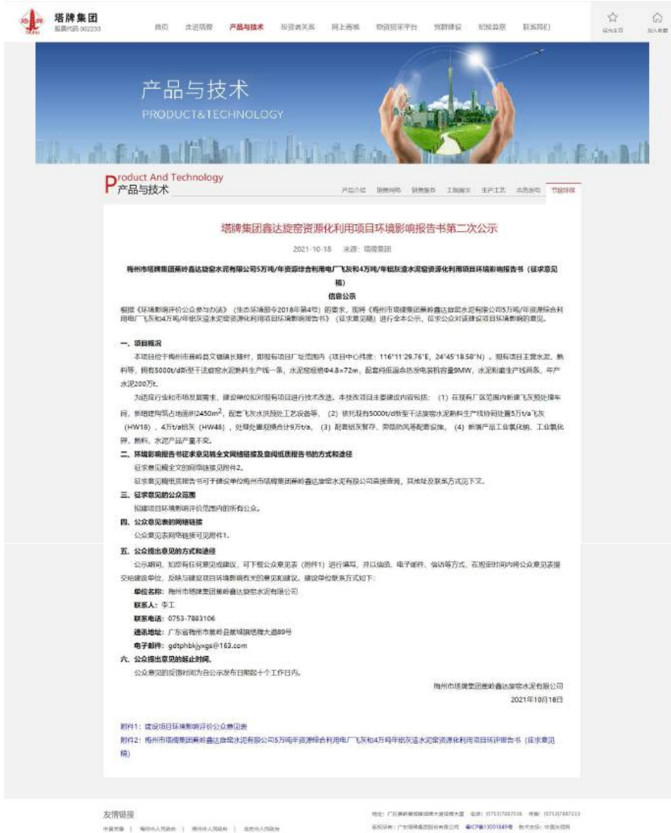
图 3-1 征求意见稿公示网络公示截图（广东塔牌集团股份有限公司网站截图）