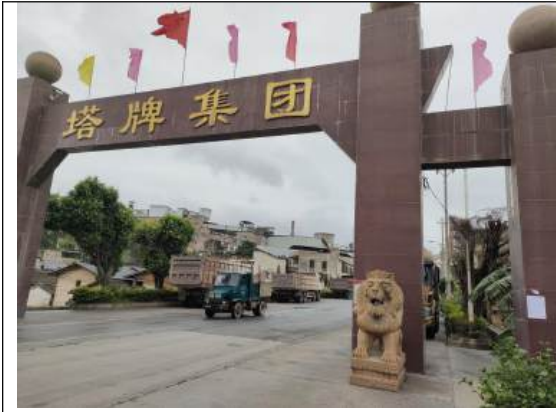
厂区门口公示远照