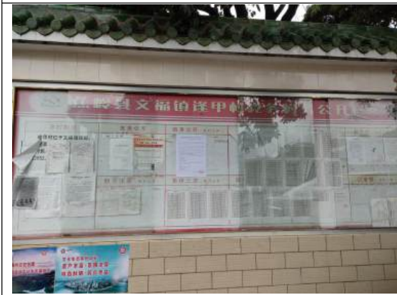
逢甲村村委会公示远照