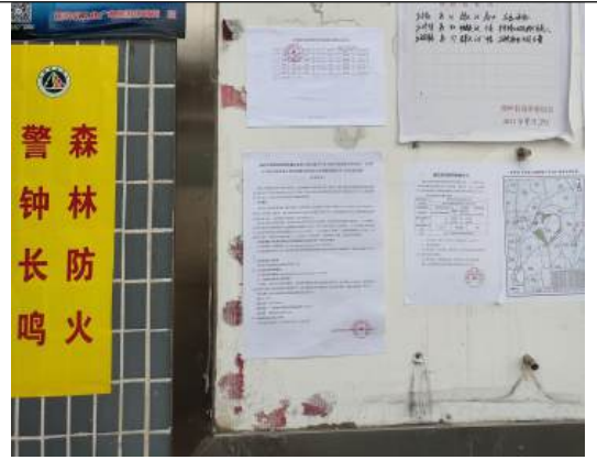
白湖村村委会公示近照