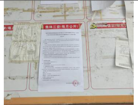
鹤湖村村委会公示近照