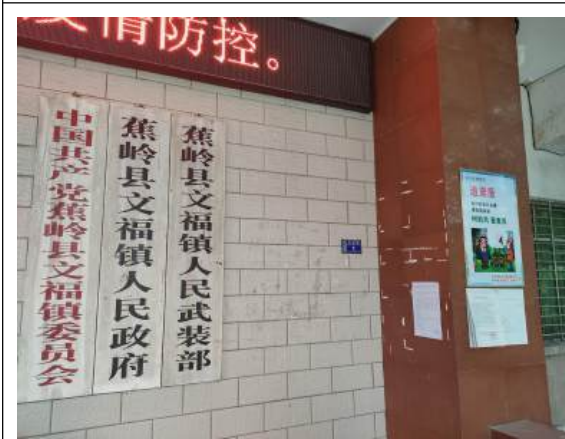
文福镇政府公示远照