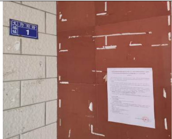
文福镇政府公示近照