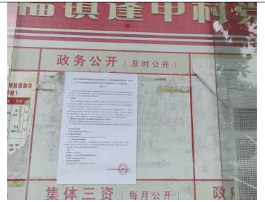
逢甲村村委会公示近照