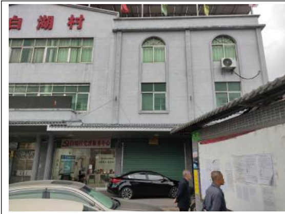
白湖村村委会公示远照