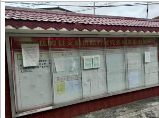
暗石村村委会公示远照