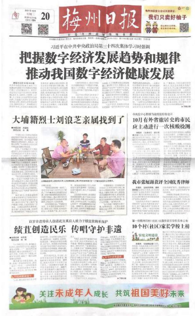
图 3-3 征求意见稿公示报纸公示截图（第 1 次）