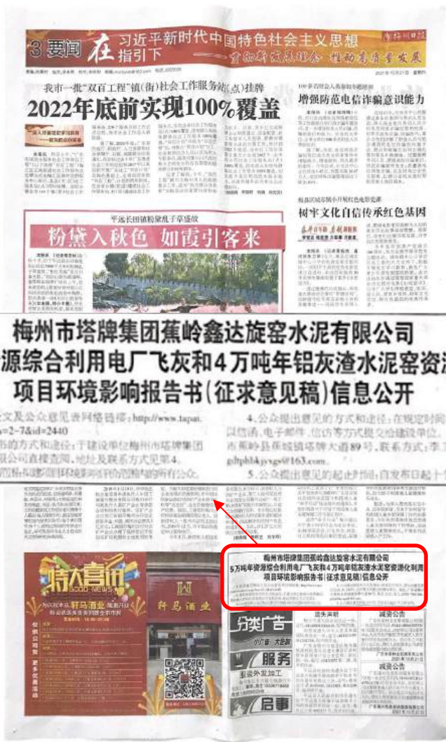
图 3-4 征求意见稿公示报纸公示截图（第 2 次）