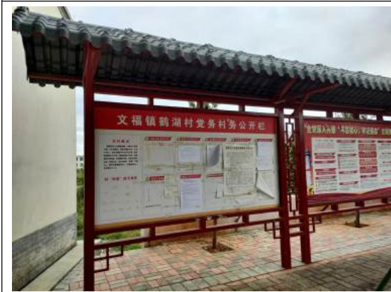
鹤湖村村委会公示远照