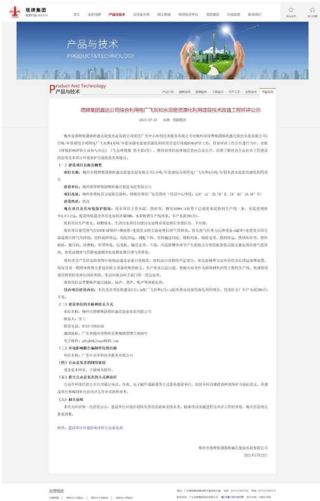
图 2-1 首次环境影响评价信息网络公示截图