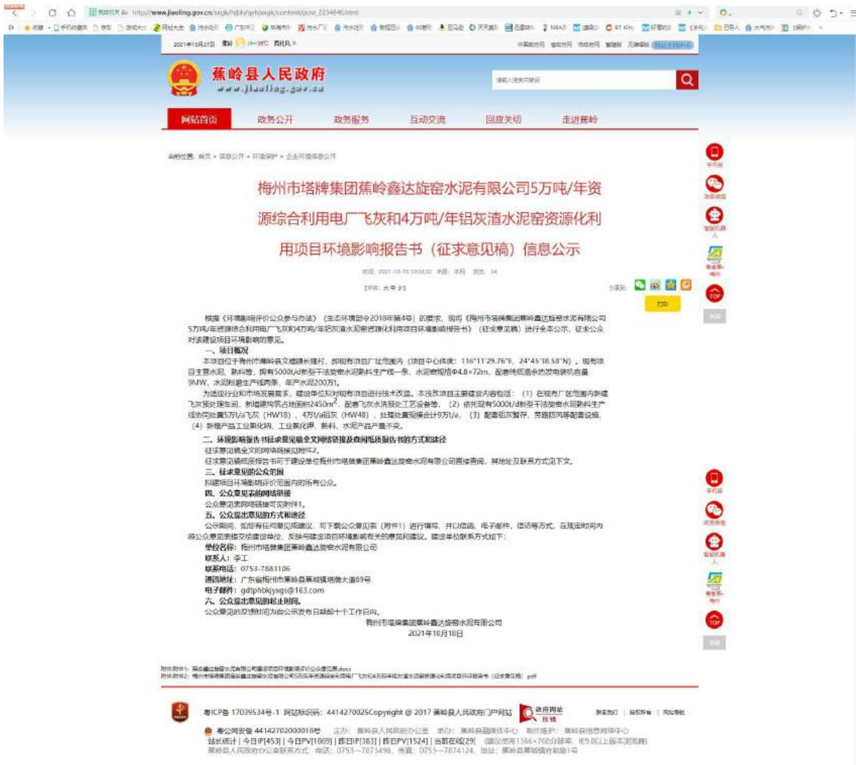
图 3-2 征求意见稿公示网络公示截图（蕉岭县人民政府网站截图）