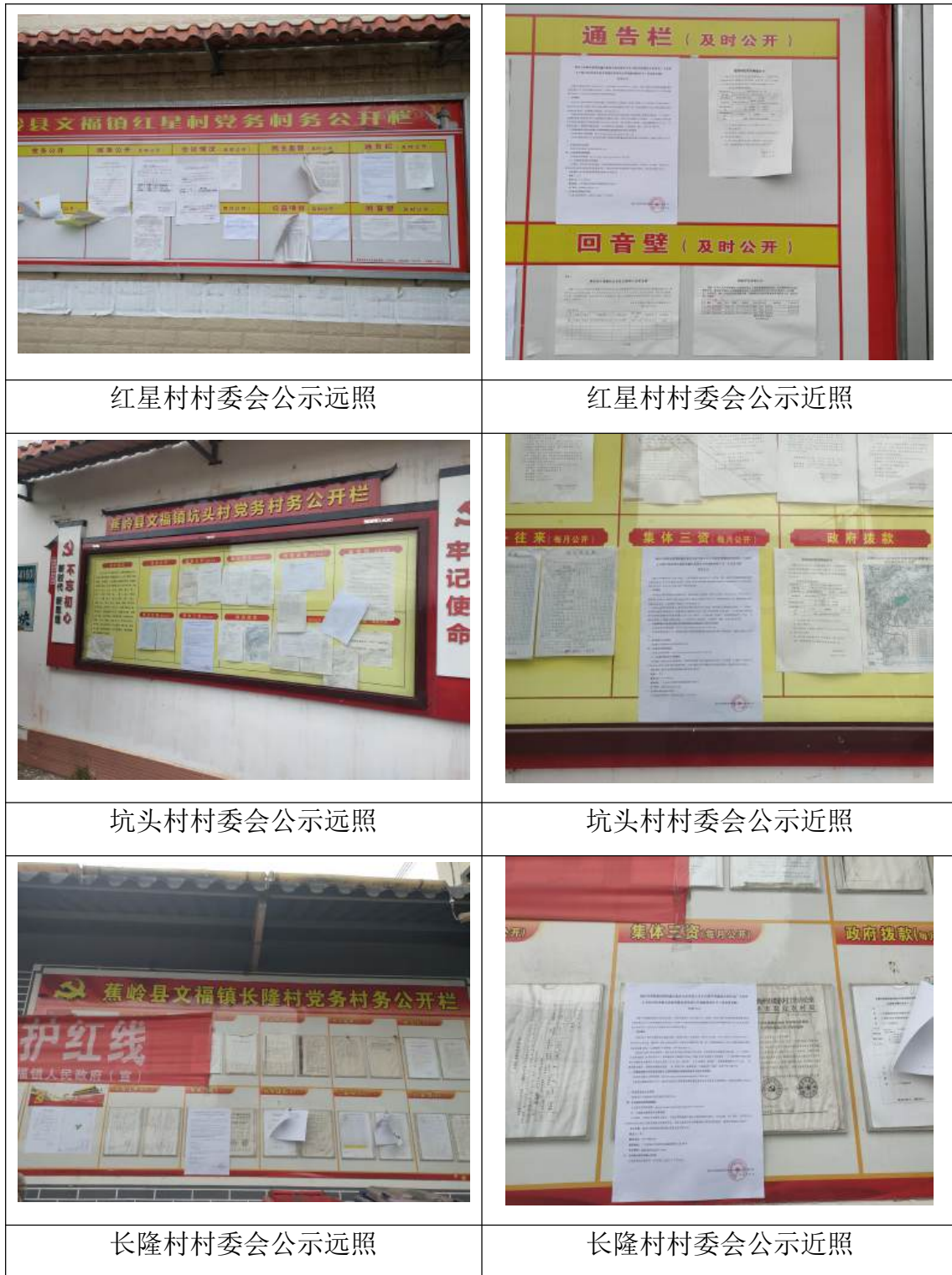
图 3-5 公众参与征求意见稿公开现场公示照片